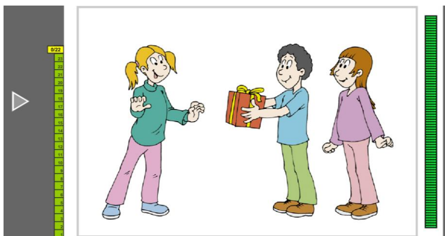
Εικόνα 3: Εικόνα για την αξιολόγηση της πραγματολογικής επάρκειας